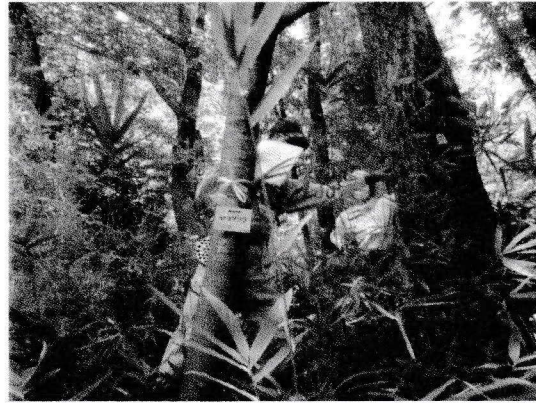
木の名札 取り付け