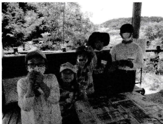
竹細工のカエル君完成