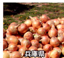
兵庫県 南あわじ市