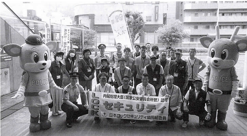
「ロックの日」住宅侵入窃盗被害防止啓発 ベルテラスいこまにて 2025.6.9