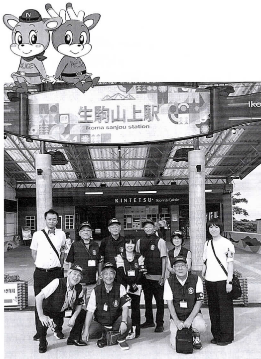
中地区 非行・被害防止啓発 生駒山上遊園地にて 2025.8.8

私たちの活動にご興味のある方は、最寄りの補導員、もしくは生駒警察署生活安全課（77-0110）までご連絡ください。