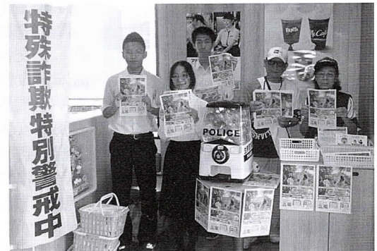
南地区 安全安心アプリ「ナポリス」普及活動 生駒高校の生徒さんたちと マクドナルド南生駒店にて 2025.7.18