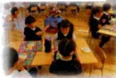
みんなで食べると おいしいね!