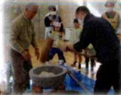
ボランティアさんや 小学校の先生も来て くださいました!

ぺったんぺったんおもちをついて年長組の子ども達が鏡餅をつくりました。手作りの飾りをつけて鏡餅の完成! 素敵な新年になりそうです。