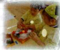
飾り付けをして 小学校へお届けです!